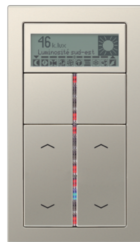
KNX-Roomcontroller 4 voies équipé de touches avec symboles flèches

Pour satisfaire les exigences d'une gestion complexe des bâtiments KNX, le Roomcontroller RCD de la gamme LS 990 permet depuis plusieurs années d'obtenir des résultats irréprochables.